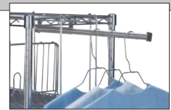
Tige de penderie