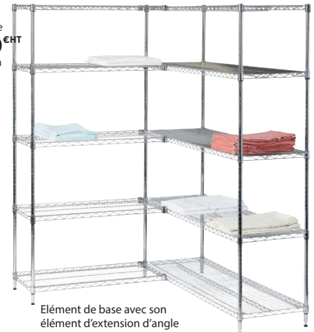
Élément de base avec son élément d'extension d'angle