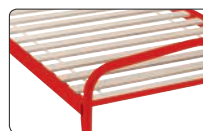
Lattes "fagot" à dérouler