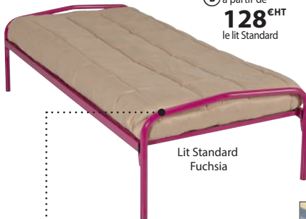
Lit Standard Fuchsia

Lit Essentiel à visser 1 traverse de renfort