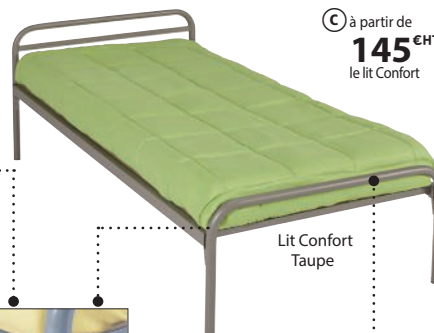
Lit Confort Taupe

Tête et pied forme "chapeau" 2 traverses de renfort