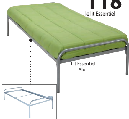
Lit Essentiel Alu