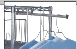
Tige de penderie