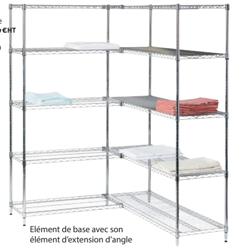
Élément de base avec son élément d'extension d'angle